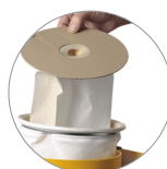
Sacchetto fleece e filtro tela