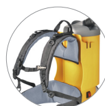
Comoda imbragatura anatomica porta accessori