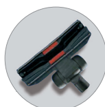
Bocchetta polvere con ruote RD 285