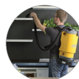
Leggero e maneggevole