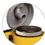
Filtro a cartuccia (HEPA optional)